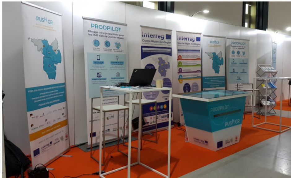
Screenshot des interaktiven Tisches auf der Messe „#GEN“, September 2021

Das Projekt PRODPILOT hat im zweiten Jahr der Projektlaufzeit ein Antrag auf Kapitalisierung gestellt. Dieser Antrag auf große Änderung des Projekts besteht darin, sich mit einem weiteren INTERREG-Projekt, PUSH.GR (bei denen die htw saar ebenfalls federführende Begünstigte ist), zusammenzuschließen, um einen interaktiven Tisch anzuschaffen, mit dem die Projekte bei Netzwerkveranstaltungen, Messen und anderen öffentlichen Veranstaltungen besser beworben werden können.